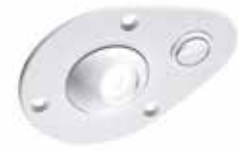
POWER LED SPOT