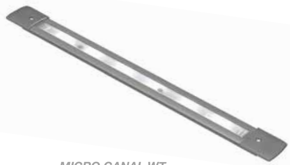
MICRO CANAL WT