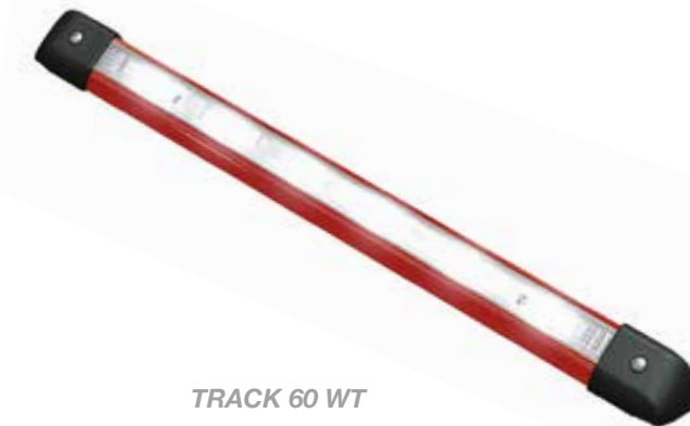
TRACK 60 WT