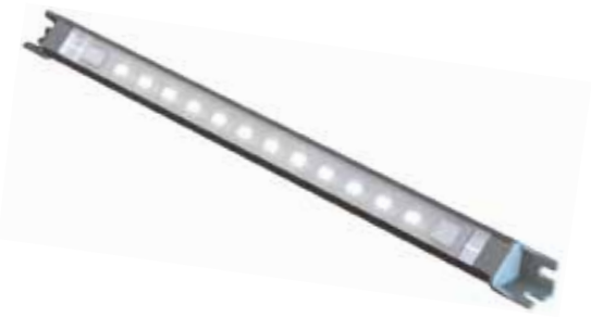
MICRO EDGE WT